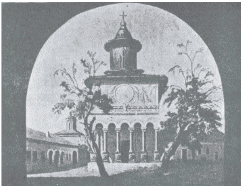
Biserica Antim, înainte de reparația din 1860. După o stampă a epocii.