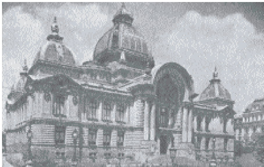
Casa de depuneri