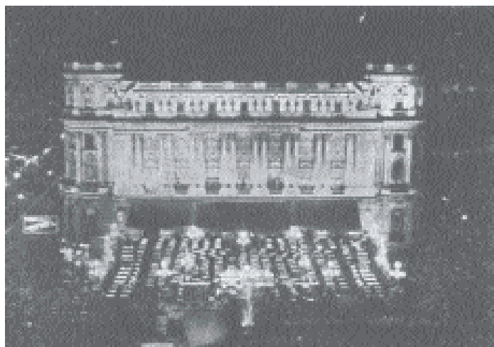
Cercul Militar noaptea