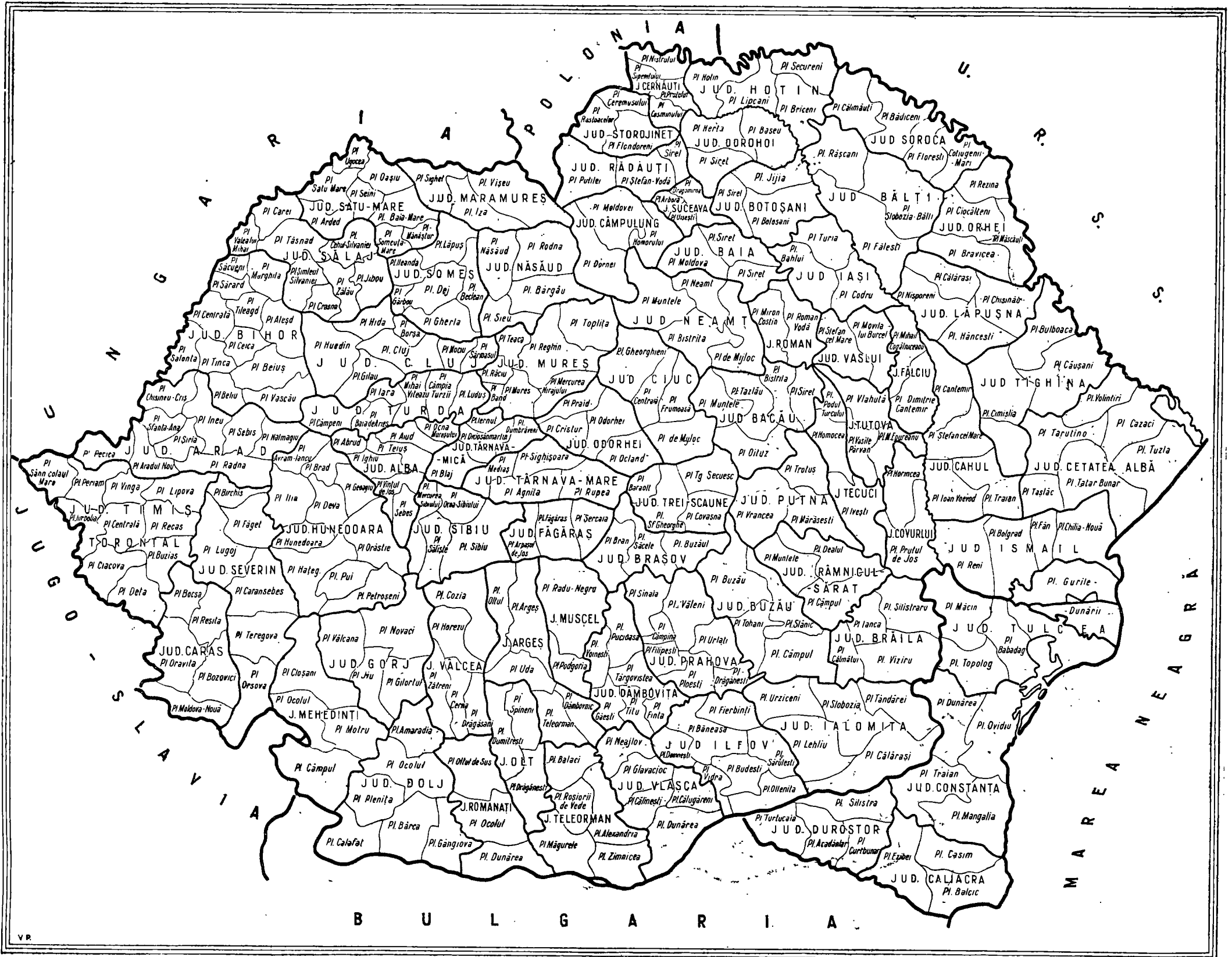
Harta 2. — Știința de carte a populației rurale mai mari de 7 ani, pe județe, la data recensământului din 1930 (hartă de orientare cu împărțirea administrativă din 1930).