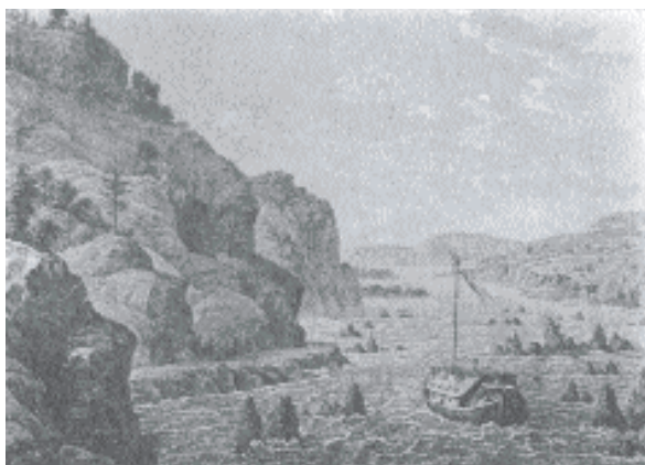
Porțile de Fier la 1820: Din albumul lui Iacob Alt: Donau-Ansichten , col. Academiei Române.

Cu materialul său uman chibzuit și dibaci și bogățiile-i numeroase, Severinul e un județ, care cere și merită o intensă acțiune de punere în valoare. Ar fi nevoie de lucrări mari, care să atragă elemente dinamice din alte ținuturi, și de o acțiune de ridicare a nivelului său sanitar la nivelul cultural și economic pe care l-a atins, spre a-i scădea mortalitatea.